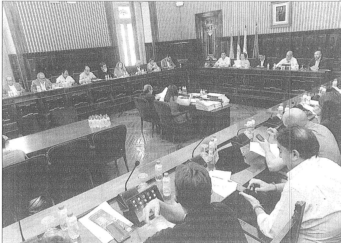
POLÍTICA. La Corporación Provincial, reunida en sesión plenaria, en la sede de la Diputación.